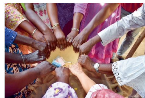
Alle Frauen geben etwas in die Kalebasse – wer nichts hat, gibt einen Kieselstein. So wahrt jede ihre Würde.