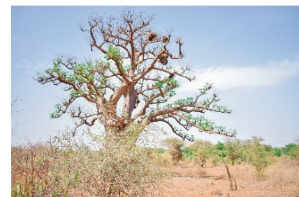
Der Senegal: oft trocken und karg

Haben Sie das Wort «Kalebasse» schon einmal gehört? Eine Kalebasse bezeichnet sowohl ein Gefäss als auch eine Gruppe. Für viele Menschen im Senegal bedeutet Kalebasse aber vor allem: Solidarität, Würde und Transparenz.