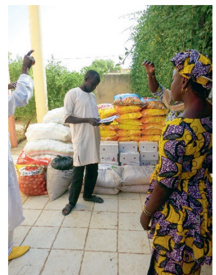
Zusammen kaufen die Menschen günstiger grössere Mengen ein.

Es hat sich gezeigt: Die Kalebassen funktionieren richtig gut. Sie sind weit mehr als nur Spargruppen – sie stärken die Gemeinschaft und geben vielen Familien neue Perspektiven. Mehr Informationen finden Sie in der Beilage zur Fastenaktion.