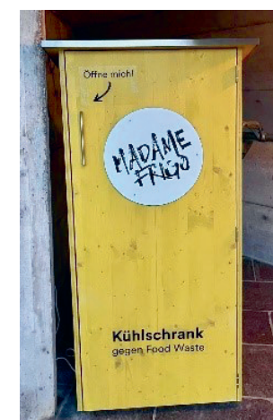
Madame Frigo beim Veloständer

Seit letzten September steht die Madame Frigo beim Veloständer. Vielleicht haben Sie dort auch schon Lebensmittel mitgenommen oder hineingelegt? Ein Team von Freiwilligen in Zusammenarbeit mit dem Forum 21, der reformierten Kirchgemeinde und der Stadt Illnau-Effretikon kontrolliert den Kühlschrank täglich. Manchmal zeugt ein Blick in die Madame Frigo von gähnender Leere, auch wenn immer wieder Menschen noch geniessbare Lebensmittel reinstellen. Es zeigt, dass Madame Frigo rege benutzt wird und beliebt ist. Haben Sie noch geniessbare, originalverpackte Lebensmittel übrig, weil Sie beispielsweise zu viel eingekauft haben? Madame Frigo freut sich darüber – und mit ihr viele Menschen!