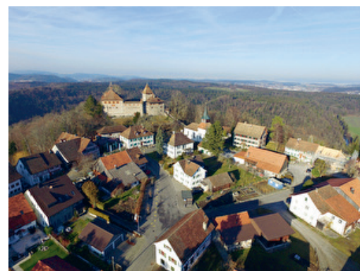
Willkommen, Weisslingen und Kyburg!